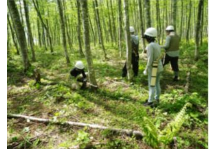
春の林業体験の様子