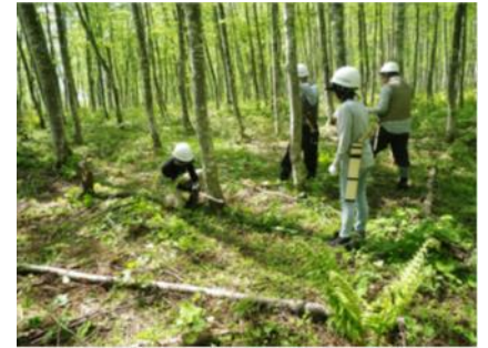
春の林業体験の様子