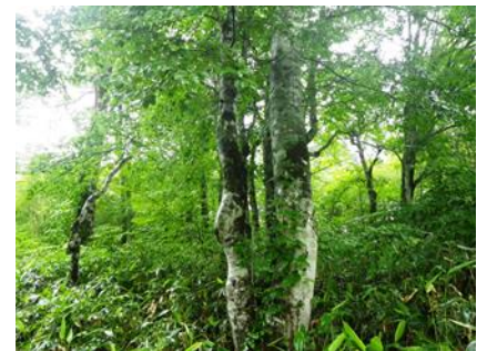
奥利根水源の森のブナの木