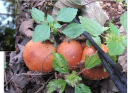
キノコ（水源の森にて）