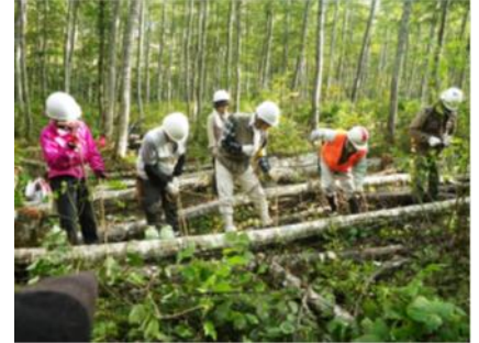
秋の林業体験の様子

13:00 「ならまた体験活動の森」（林業体験地） ～林業体験（間伐等）～ 林業体験終了後ミーティング